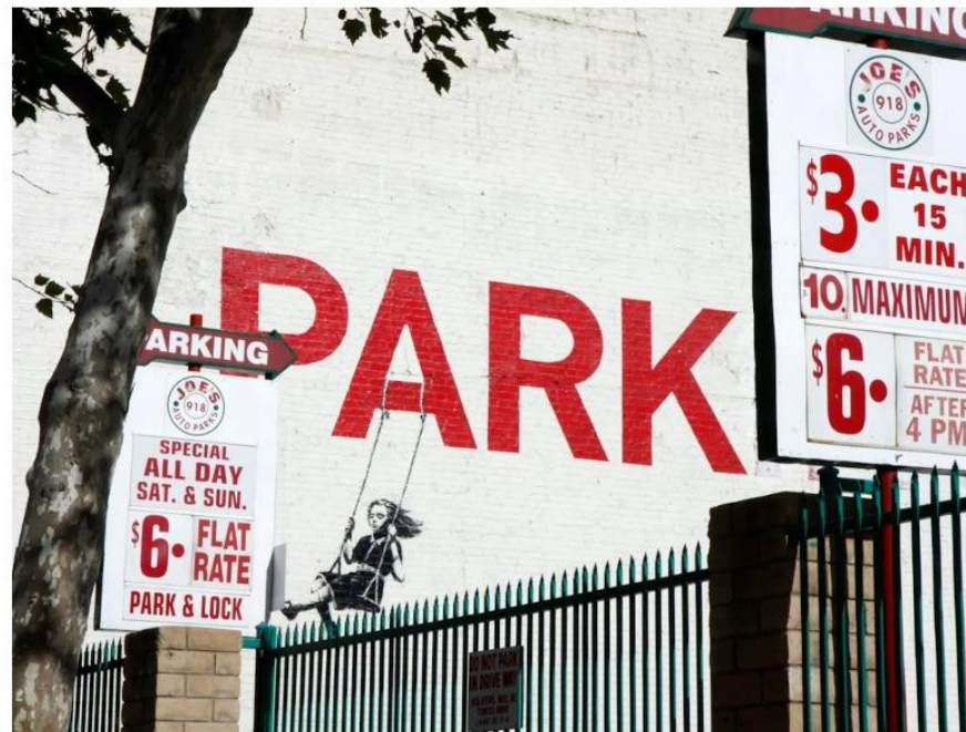
The LA building could fetch $30 million.

BY SHANTI ESCALANTE-DE MATTEI September 2, 2022 1:46pm