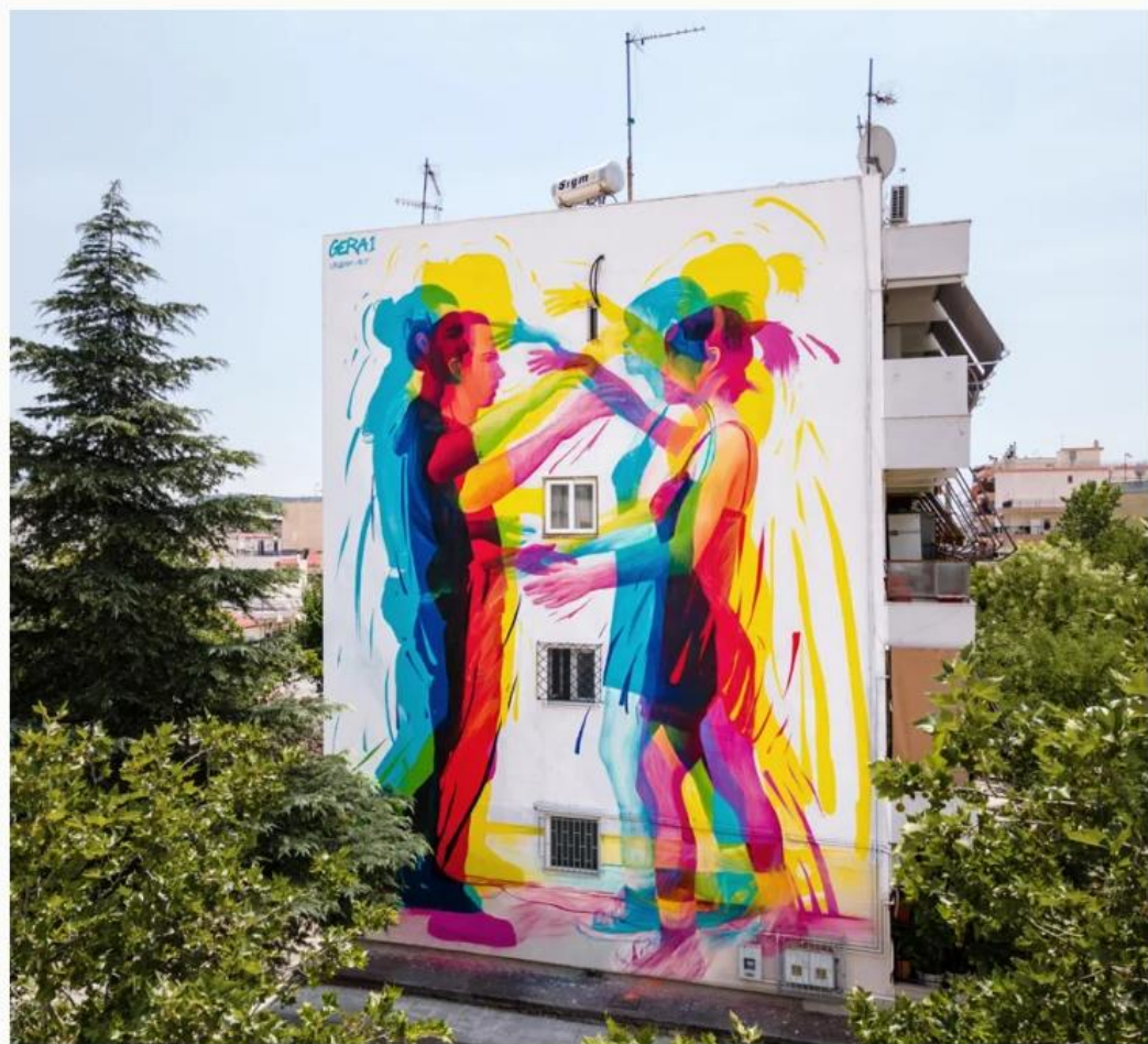
"Interaction", γκράφιτι του Gera στο Βόλο, 2020